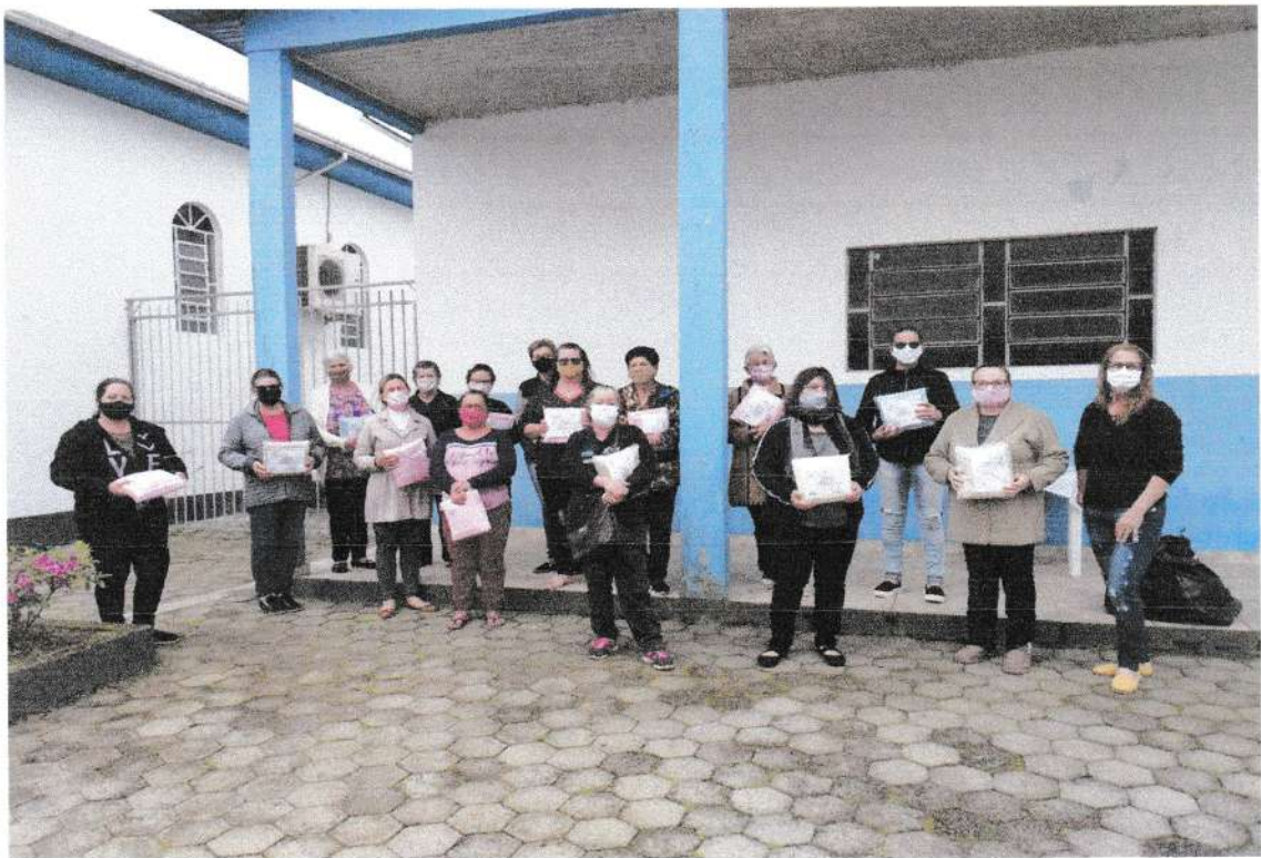
Clube da Mães do Bairro Saturno