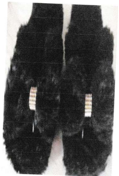
Imagens tiradas da internet