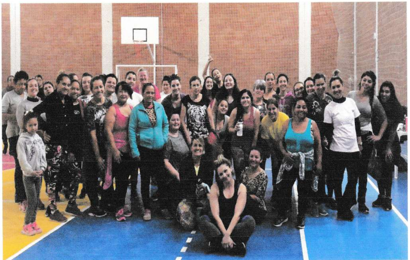
Grupo de Zumba no Bairro Santa Cruz (2019)