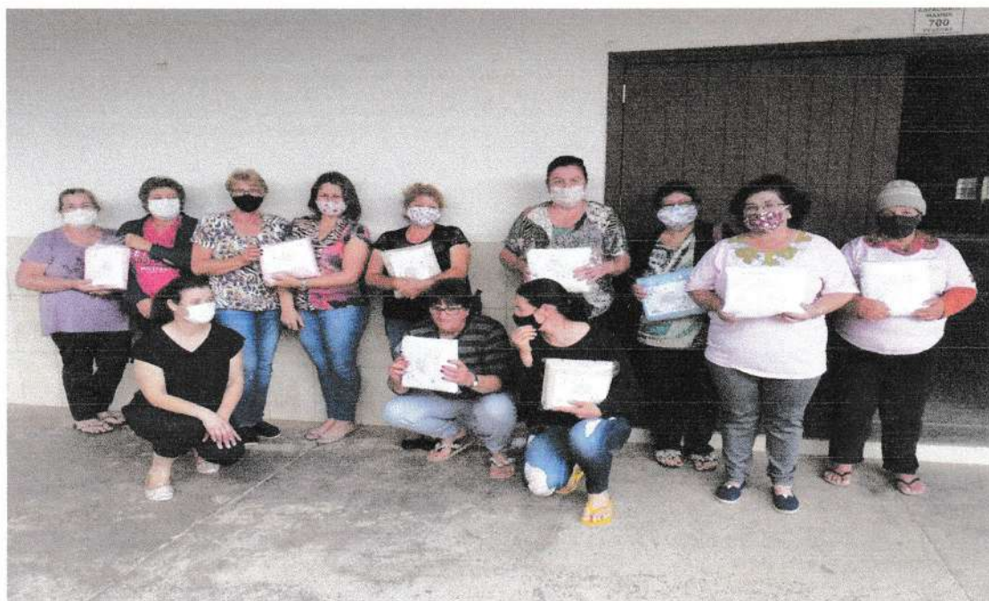
Clube de Mães da Sanga do Café