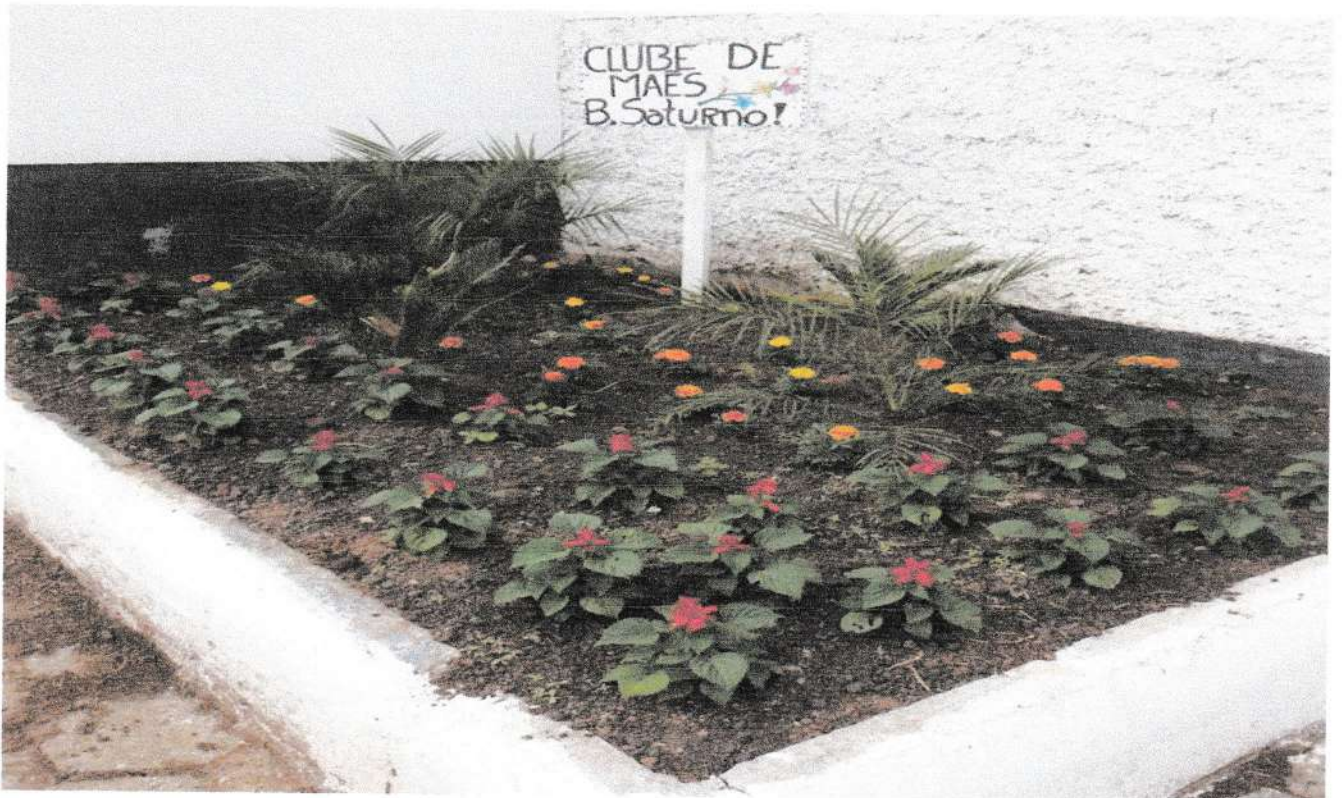
Clube de Mães Bairro Saturno