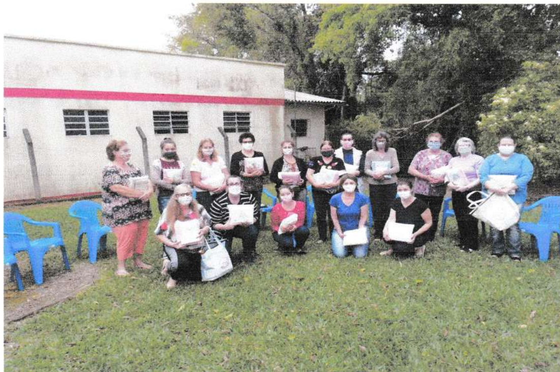
Clube de Mães Casa da Sanga do Engenho

imaginação e criação. Esta atividade estimula não só a mente, mais também o corpo. O artesanato tem ação direta nas terminações nervosas que ficam localizadas nas pontas dos dedos que estão ligadas a diversas partes do cérebro. Isso aumenta a percepção a atenção e funções das linguagens. Atendendo assim os objetivos da entidade: estimular e promover o desenvolvimento de atividades culturais, esportivas, sociais e recreativas e despertar a consciência participativa e comunitária, buscar a melhoria na qualidade de vida, qualificação profissional, emancipação da pessoa humana, como também a aprendizagem de técnicas de trabalhos manuais que possam complementar a renda familiar. Segue fotos do ano de 2020: