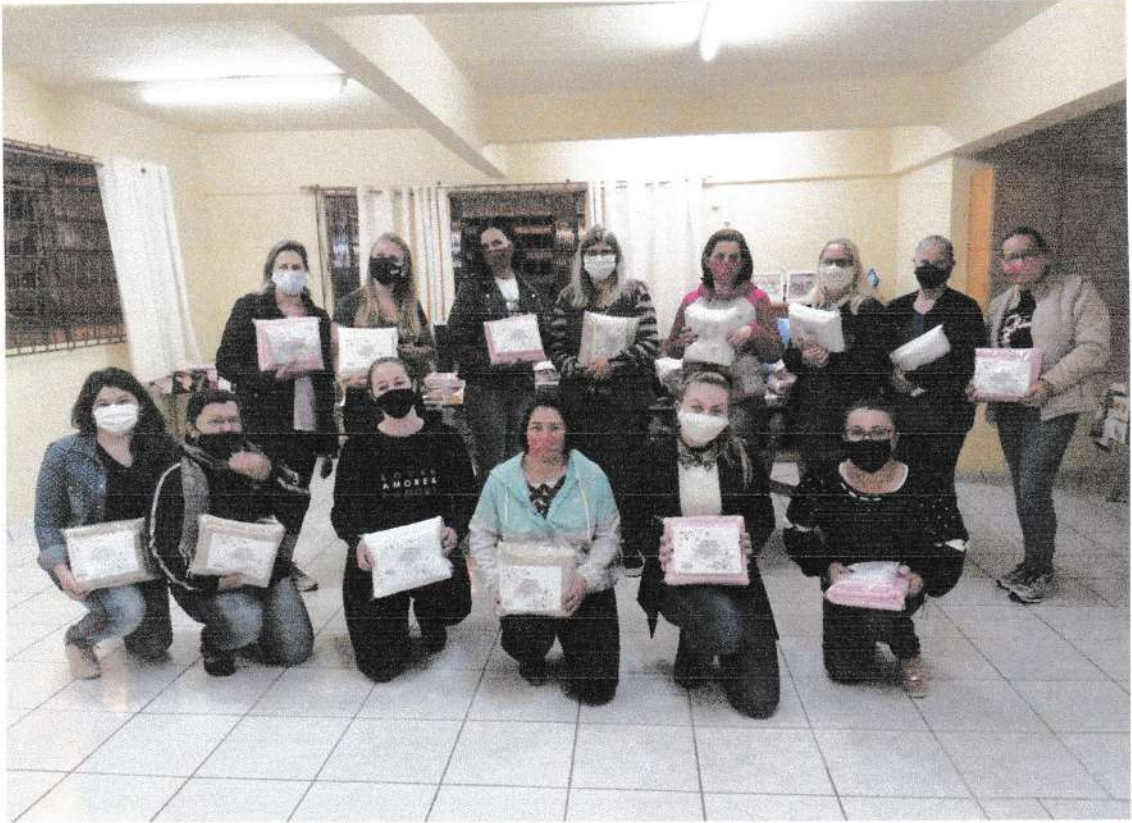
Clube de Mães Noturno (Santa Isabel)