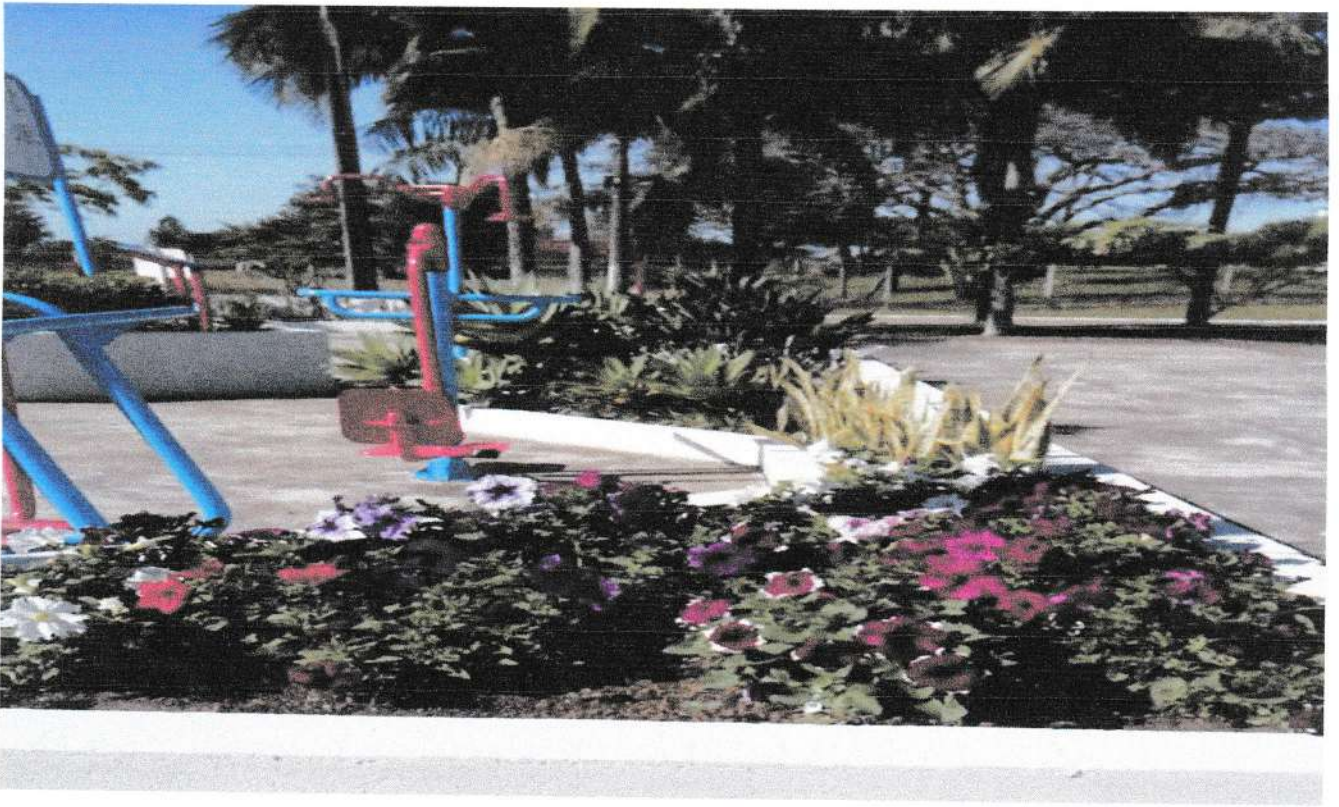
Canteiro de Flor cuidado pelo Clube de Mães santa Rosa