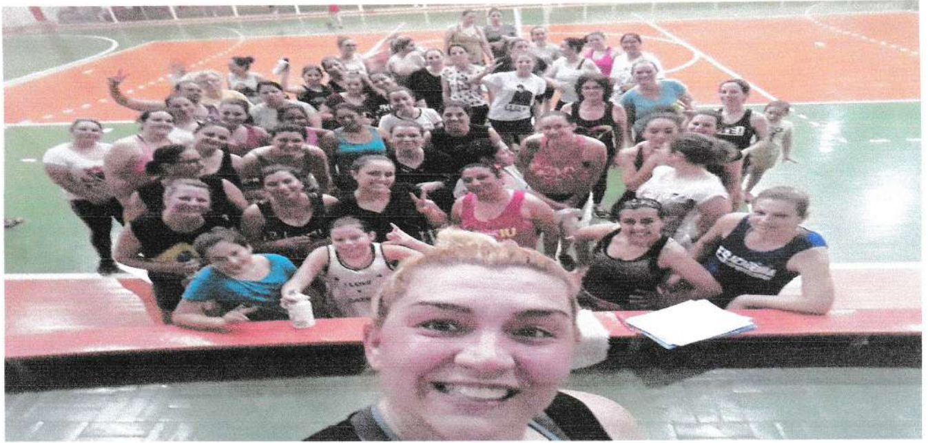
Grupo de Zumba do Centro (2019)

pois devido às restrições foram cancelas as atividades de 2020. A Associação quer continuar esta atividade em 2021 ao ar livre e com distanciamento, pois os benefícios no sistema imunológico está cientificamente comprovado.