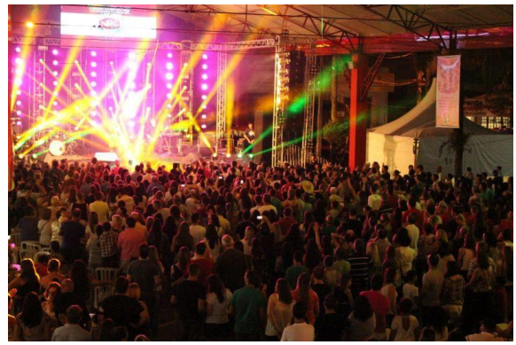
Figure 48 - Shows na Heimatfest.