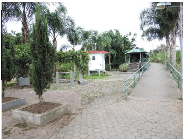
Figure 35 - Rua de Lazer.

A Rua de Lazer é ponto de encontro de jovens e famílias. Uma praça com cem metros quadrados por 15 de largura, com pista de skate e grande área de lazer. No mesmo local, está o monumento O Desbravador, feito pelo artista Fridel Steiner, homenagem aos desbravadores de Forquilha.