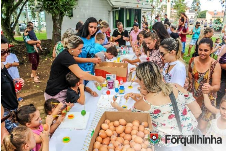
Figure 57 - Oficinas de pintura para as crianças na Osterbaum de Forquilha 2018.