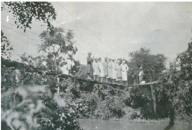
Figure 24 - Primeira Ponte Pênsil de Forquilha.

Todas as cidades da região foram colonizadas as margens dos rios, pois permitia ao acesso a água para o consumo próprio, irrigação de lavouras, transporte de produtos, e demais atividades. E o Rio Mãe Luzia é uma das marcas históricas e culturais da cidade, ainda mais pelo motivo de ter inspirado o nome Forquilha. E as pontes pênsil, de ferro e logo após concreto foram construções primordiais para o desenvolvimento do município, não como falar sobre a história sem que elas sejam citadas.