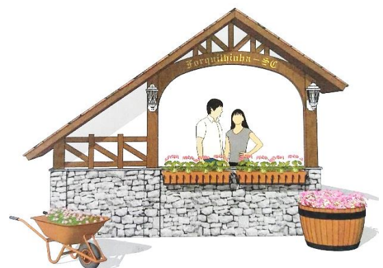
Figure 9 – Mini-portal para moldura fotográfica.