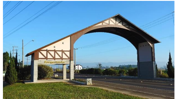
Figure 3 – Atual Porta de acesso Norte (revitalizado).