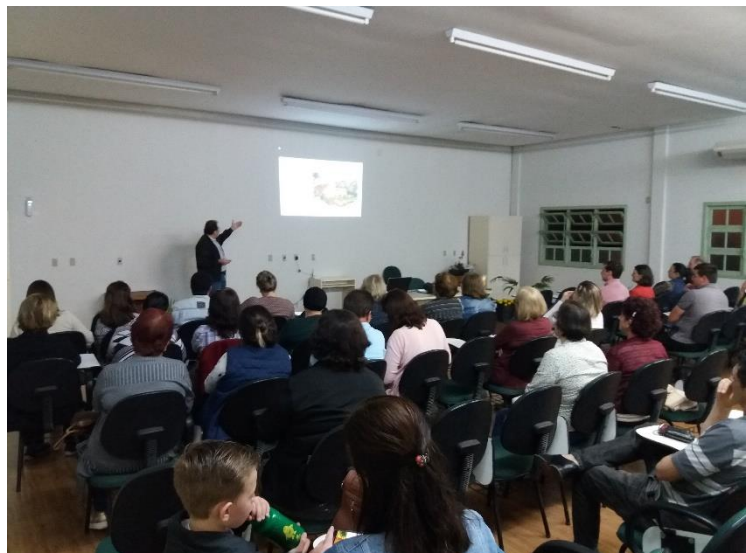
Figura 2 - Capacitação sobre os cuidados dos Jardins, 2017.