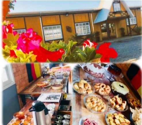
Figure 43 -Restaurantes típicos.