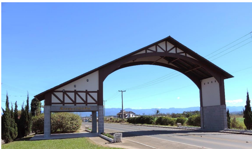
Figure 62 - Portal acesso Norte de Forquilha.

Fotos de algumas edificações existentes com a estilização enxaimel em Forquilha: