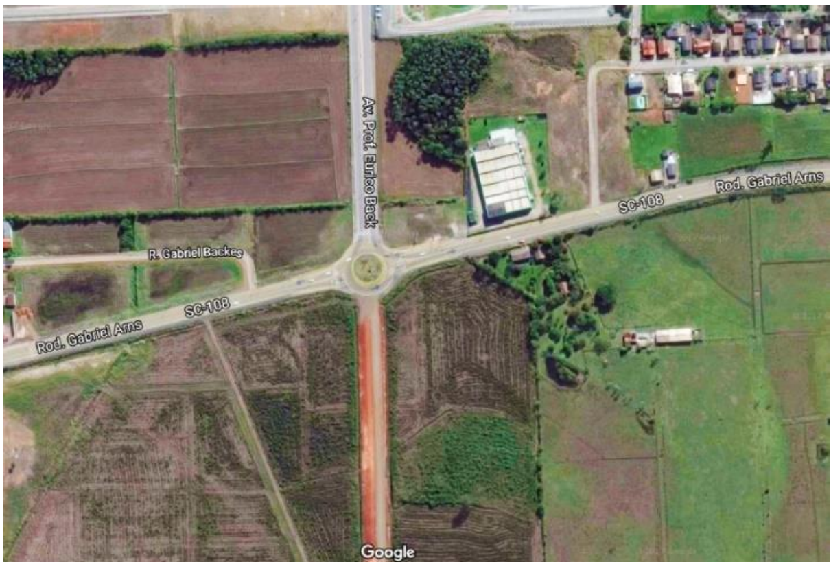
Figure 8 - Vista superior da Rodovia Gabriel Arns e Avenida Prof. Eurico Back.