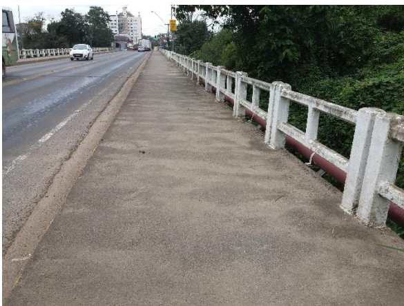
Figure 27 - Ponte Gabriel Arns.