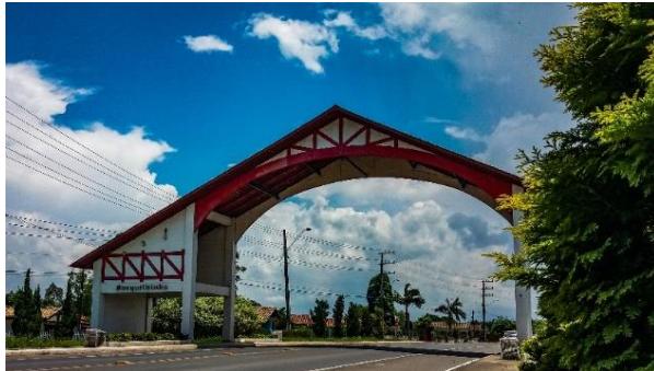
Figure 4 - Antigo Portal acesso Norte.