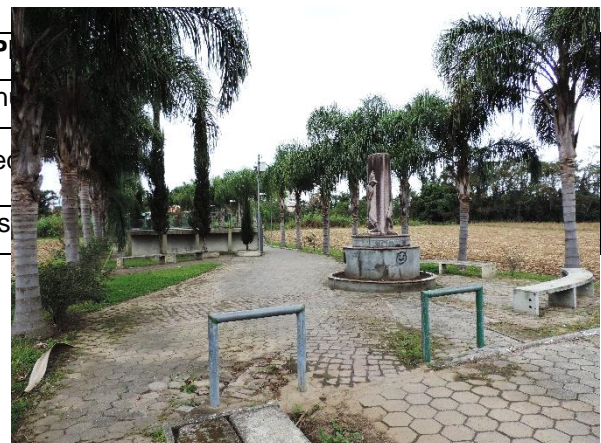
Figure 36 - Rua de Lazer.