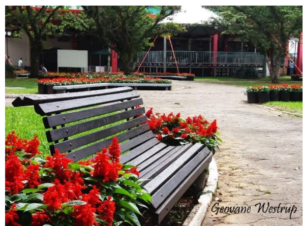
Figure 18 - Praça dos Imigrantes Alemães preparada para Heimatfest.