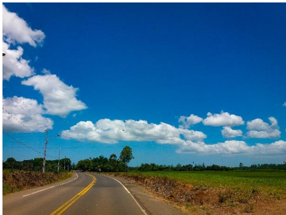
Figure 37 - Rodovia Jacob Westrup parcialmente pavimentada.