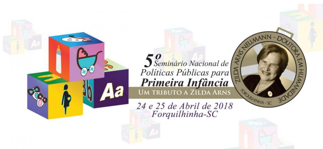
Figure 59 -Flyer divulgação do Seminário 2018.