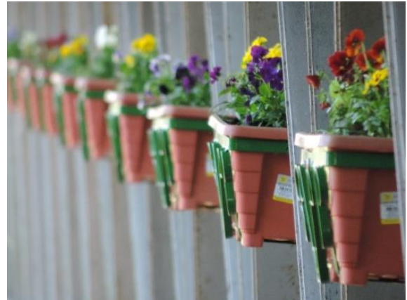
Figure 33 - Etapa de revitalização da Passarela.