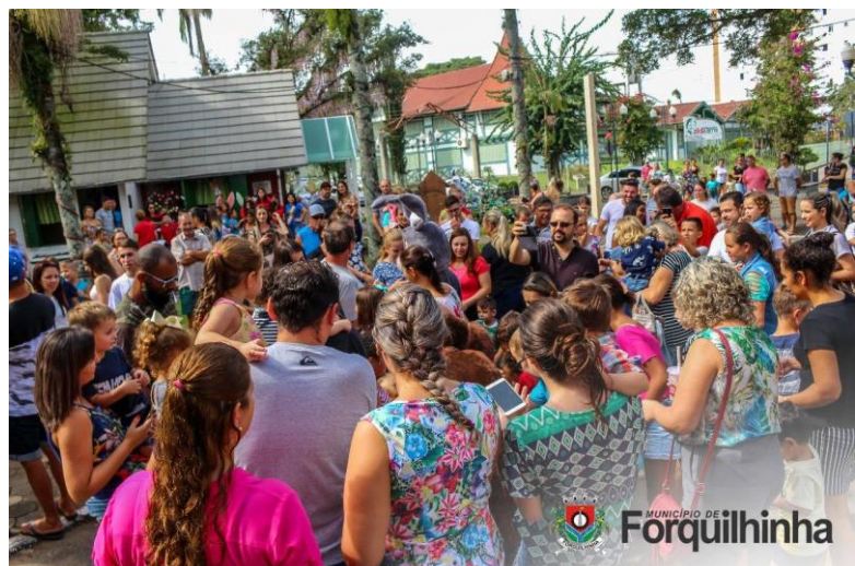
Figure 55 - Chegada do Coelho na Osterbaum de Forquilha 2018.