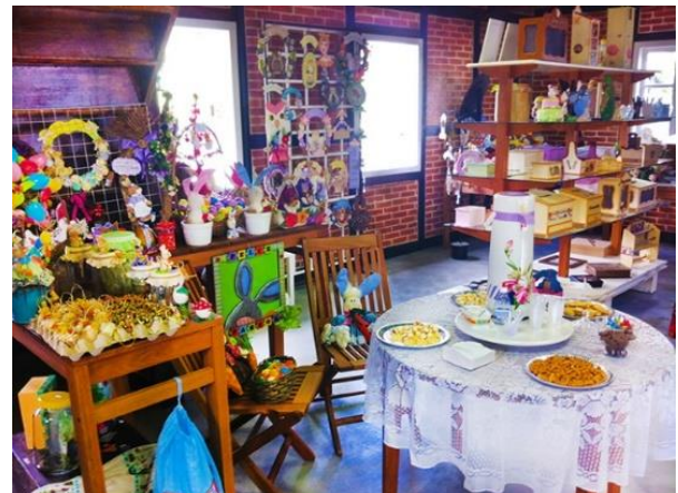
Figure 41 - Parte interna da Casa do Artesanato.