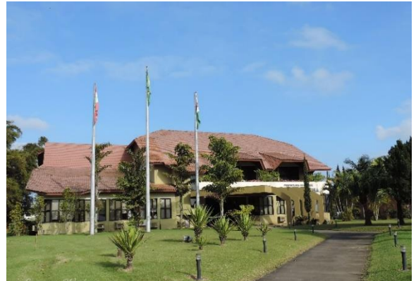
Figure 70 - Paço Municipal de Forquilha – Característica arquitetônica de Schwarzwald (Floresta Negra)