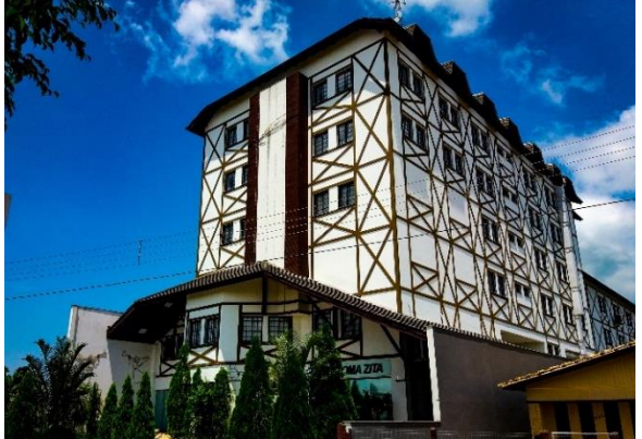
Figure 67 - Hotel Oma Zita.