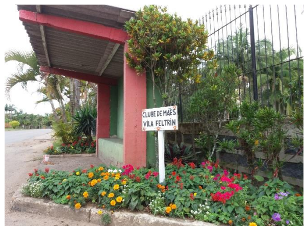
Figura 3 - Avaliação técnica dos Canteiros dos Clubes de Mães.