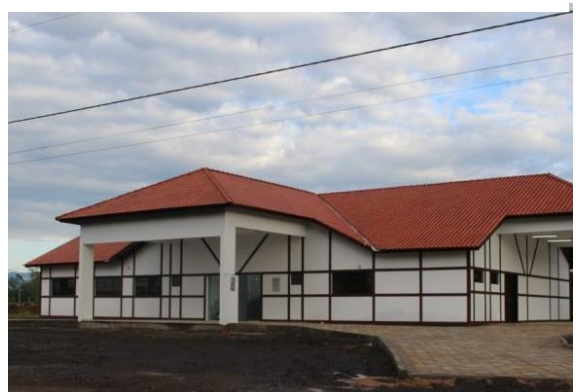
Figure 63 - Central de Especialidades de Saúde.