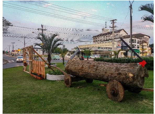
Figure 53 - Decoração temática com resgate de costumes de época para a Festa do Colono e Motorista 2018.