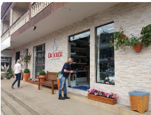
Figura 4 - Avaliação técnica do comércio.