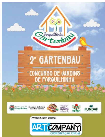
Figura 1 - Divulgação do Gartenbau 2017.