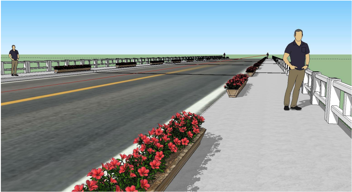
Figure 30 - Projeto de revitalização da Ponte Gabriel Arns (andamento).