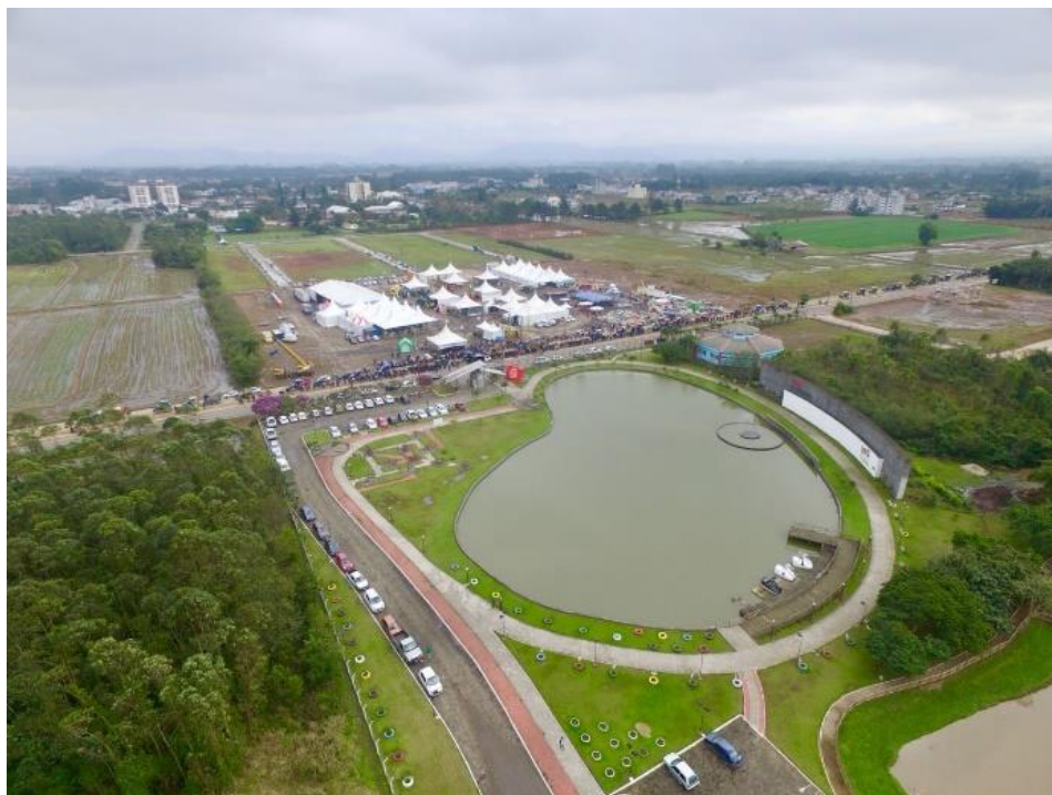
Figure 49 - Vista aérea do futuro local do Centro de Eventos.