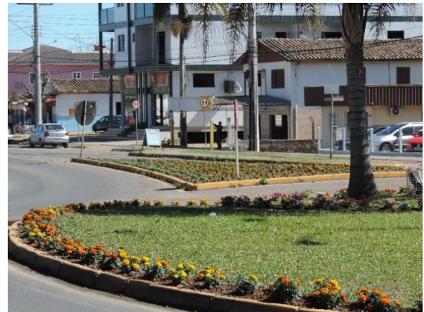
Figure 5 - Rótula revitalizada bairro Vila Franca.