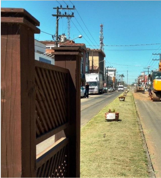
Figure 16 - Avenida 25 de Julho (antes da revitalização).