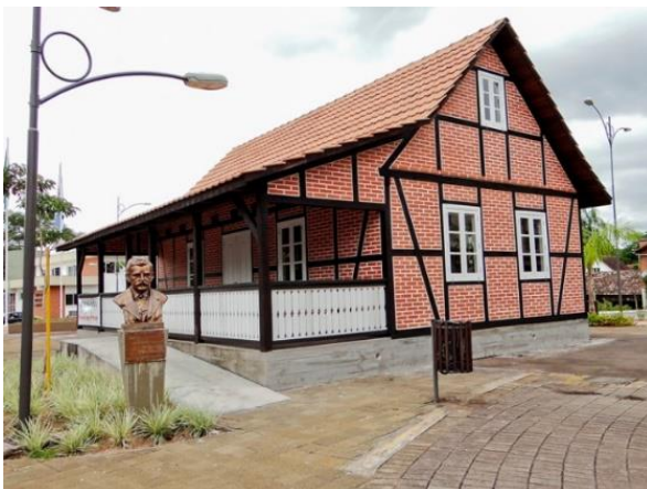
Figure 40 - Casa do Artesanato em Timbó.

Abaixo a “Casa do Artesanato” construída na cidade de Timbó/SC: