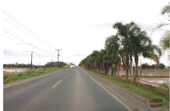
Figure 38 - Rodovia Antônio Valmor Canela.