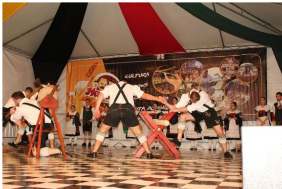
Figure 45 - Apresentações Folclóricas e Artísticas.