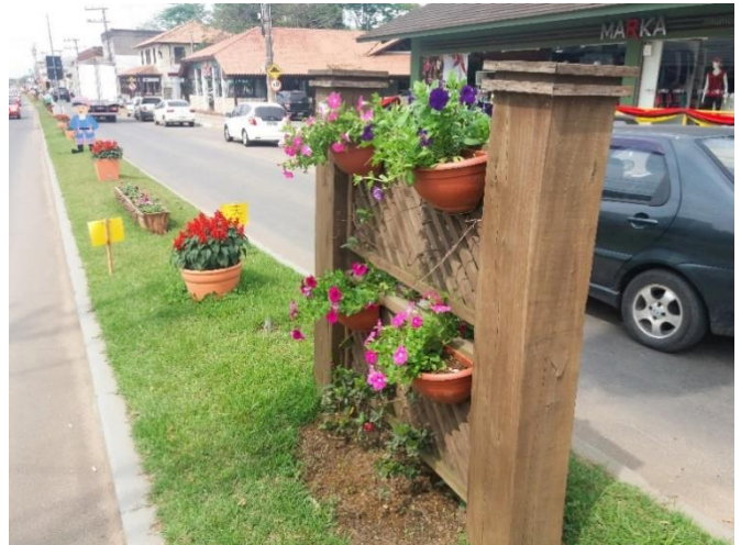
Figure 14 – Avenida 25 de Julho (revitalizada).