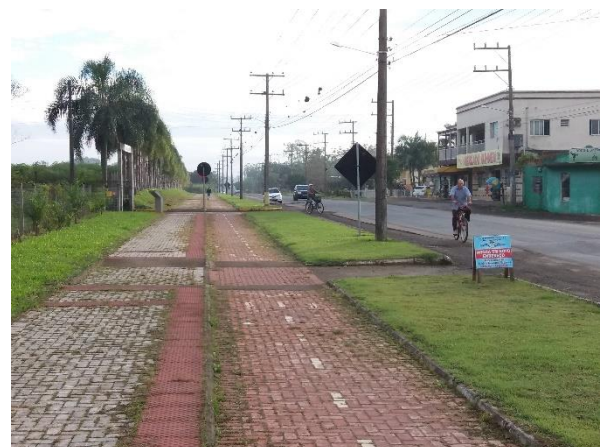
Figure 12 - Ciclovia bairro Vila Lourdes.