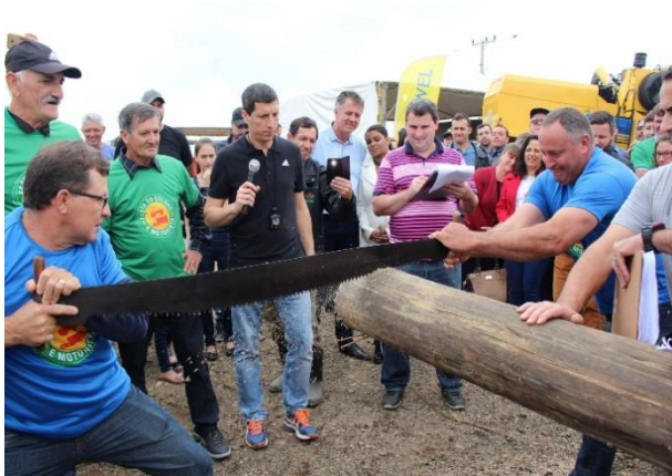
Figure 51 - Jogos Coloniais entre bairros.