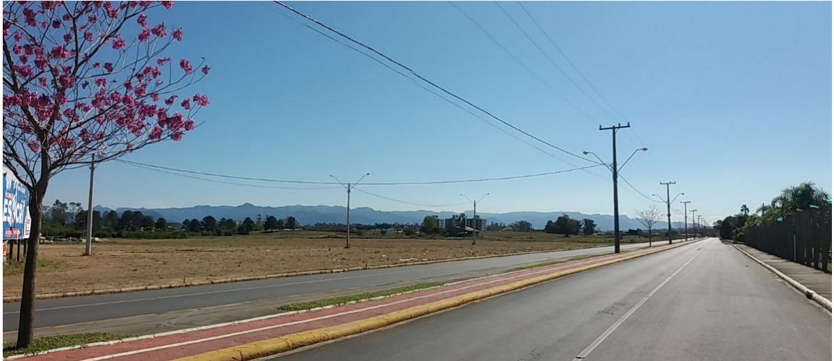
Figure 7 - Avenida Prof. Eurico Back.