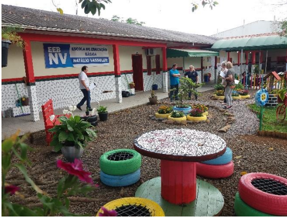
Figura 8 - Avaliação técnica nas Escolas Estaduais.