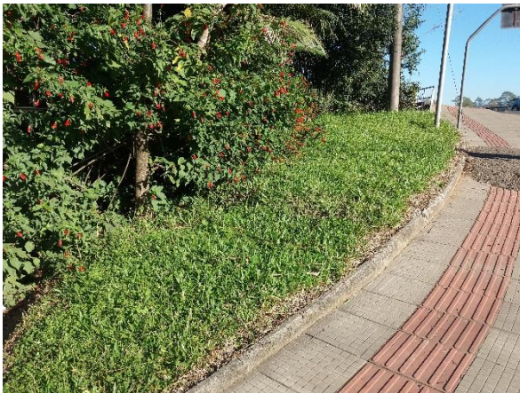
Figure 28 - Laterais da Ponte Gabriel Arns.