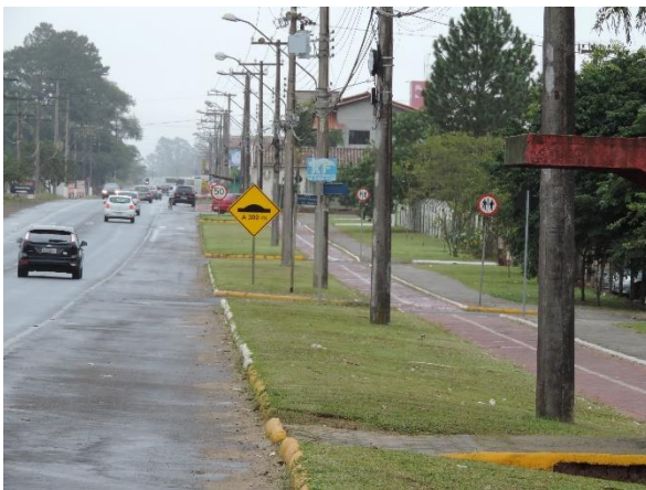
Figure 6 - Canteiros laterais bairro Saturno.