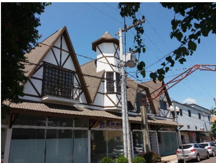
Figure 39 - Rede elétrica aérea. Poluição visual.

Entretanto, a cidade que se projeta para o desenvolvimento turístico deve se preocupar com sua imagem urbana diante do ponto de que vem com a intensão de encontrar uma cidade bem planejada, embelezada, atraente e que deixe impressa a sua identidade e o cartão de visita para um retorno garantido.