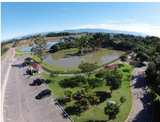
Figure 10 - Parque Ecológico São Francisco de Assis e Praça do Centenário.