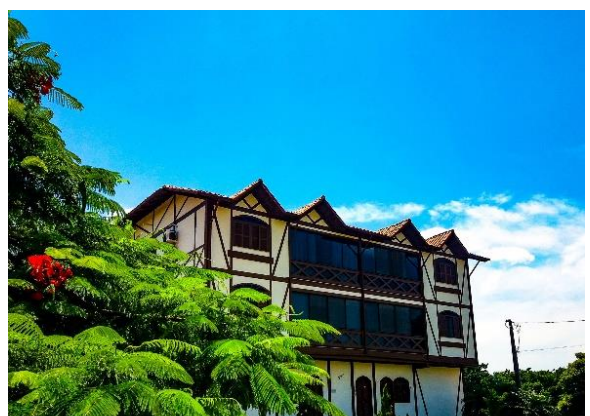
Figure 65 - Residencial Donato Steiner.