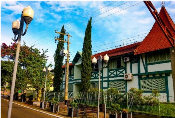
Figure 69 - Pastoral da Criança.