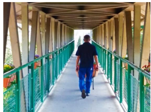
Figure 31 - Passarela parcialmente revitalizada.