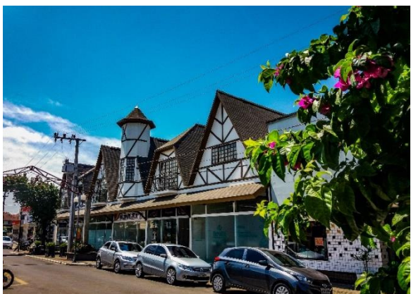
Figure 64 - Galeria Comercial - Centro de Forquilha.