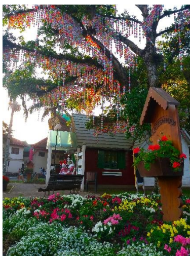
Figure 54 - Praça dos Imigrantes Alemães - Osterbaum.