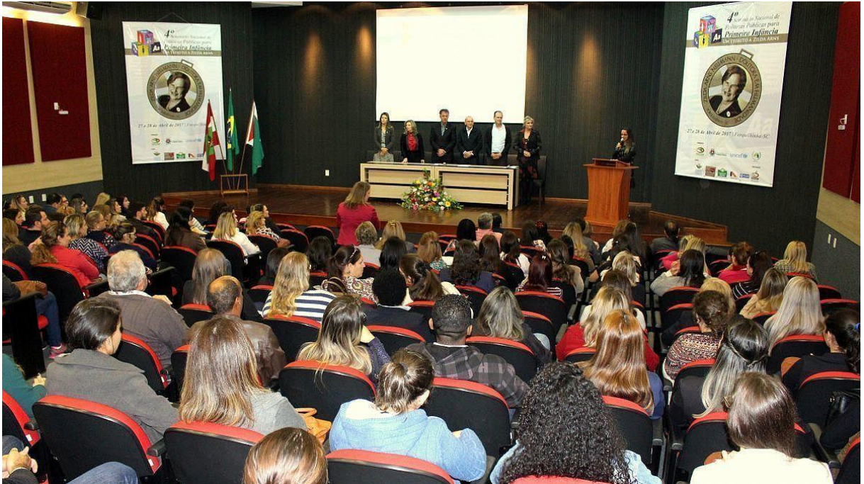
Figure 61 - Seminário de Políticas Públicas para 1 Infância e entrega da Medalha Zilda Arns 2018.