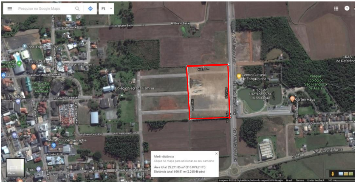
Figure 42 - Localização do Futuro Centro de Eventos.