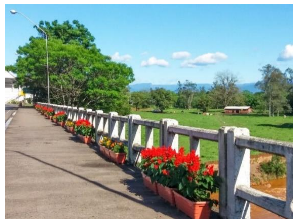
Figure 26 - Ponte Gabriel Arns (revitalização provisória)