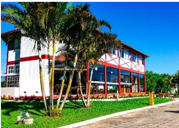
Figure 66 - Restaurante típico Gaartenhaus.