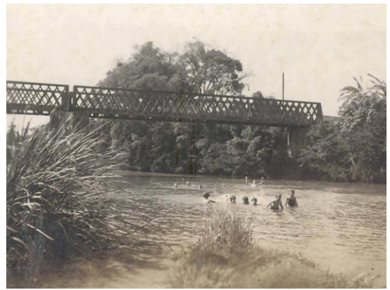
Figure 23 - A ponte de ferro que existia naquele rio foi construída entre 1949 e 1950. Desabou em 1986.