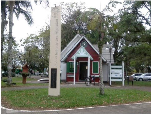
Figure 22 - Praça dos Imigrantes Alemães.