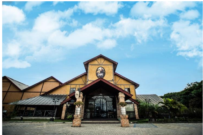
Figure 44 - Cervejaria com gastronomia típica.