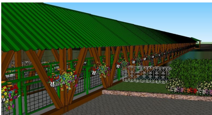
Figure 32 - Projeto de revitalização completa da Passarela e seu entorno.