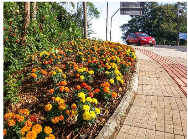
Figure 29 - Laterais da Ponte Gabriel Arns (revitalizado).