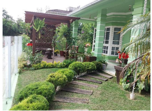
Figura 7 - Avaliação técnica nas residências.