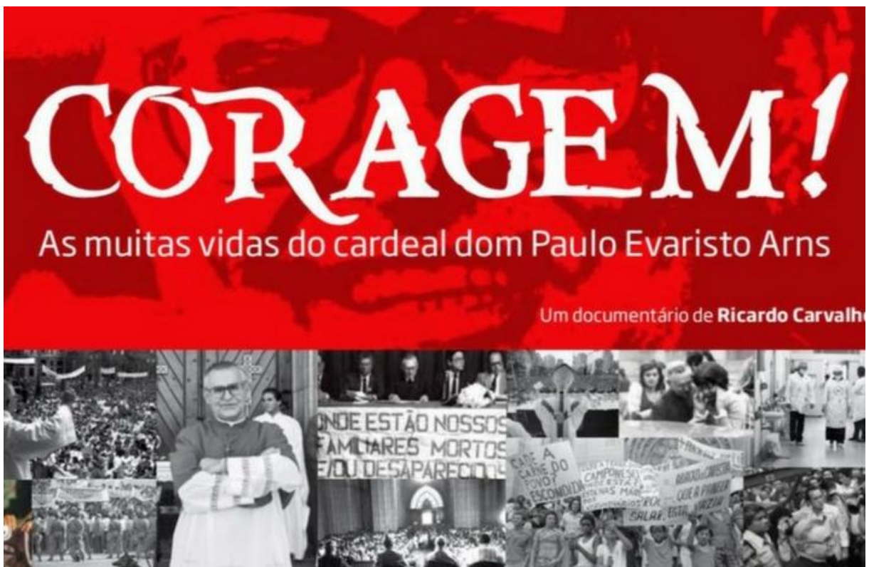
Figure 60 - Lançamento do Documentário em tributo à Dom Paulo Evaristo Arns 2018.