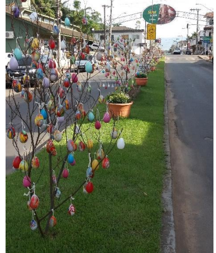
Figure 58 - Osterbaum decorando ambientes públicos.