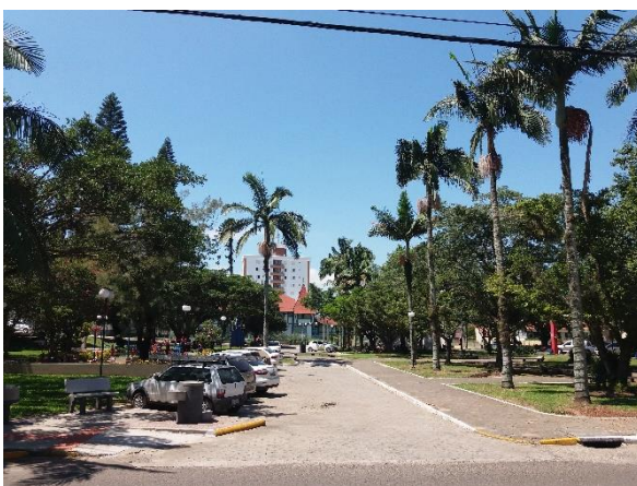
Figure 19 - Praça dos Imigrantes Alemães.