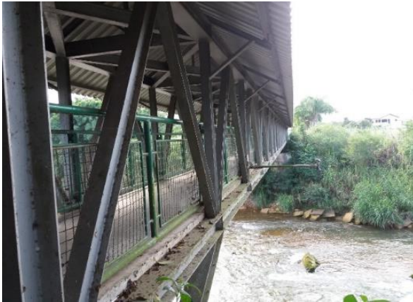
Figure 34 - Passarela sobre Rio Mãe Luzia.