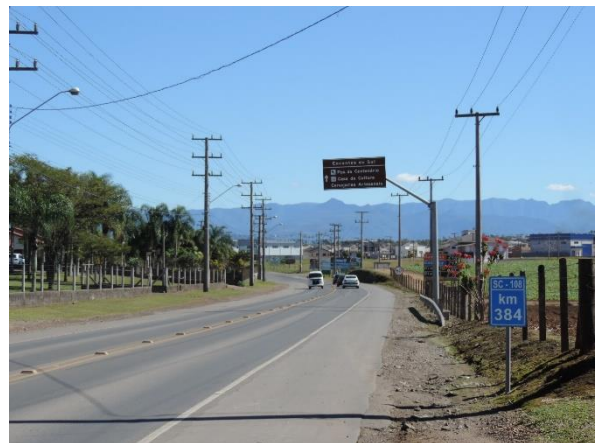
Figure 1 – Etapas a serem realizadas após Portal.