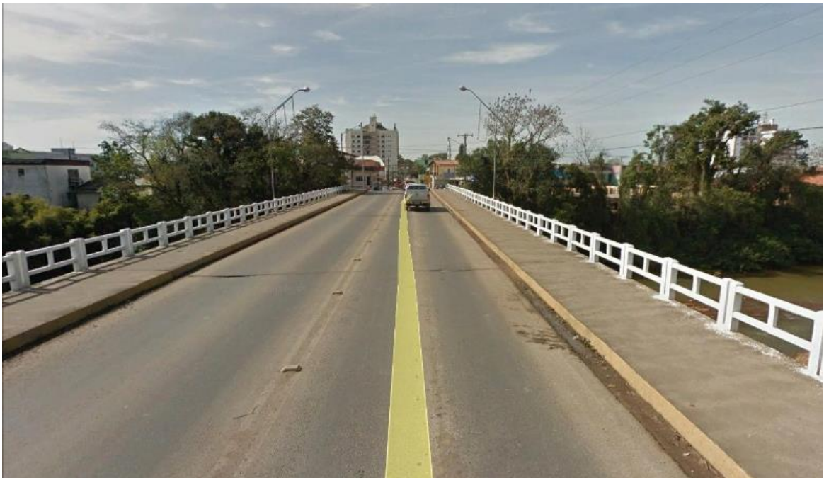
Figure 25 - Atual Ponte Gabriel Arns, Centro de Forquilha.