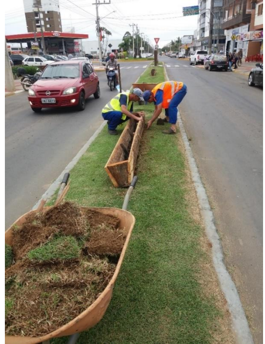
Figure 15 - Preparativos da Avenida 25 de Julho.