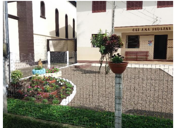
Figura 5 - Avaliação técnica nas Escolas Municipais.