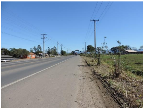
Figure 2 - Etapas a serem realizadas antes do Portal.