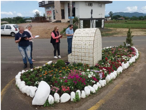
Figura 6 - Avaliação técnica dos Canteiros dos Clubes de Mães.