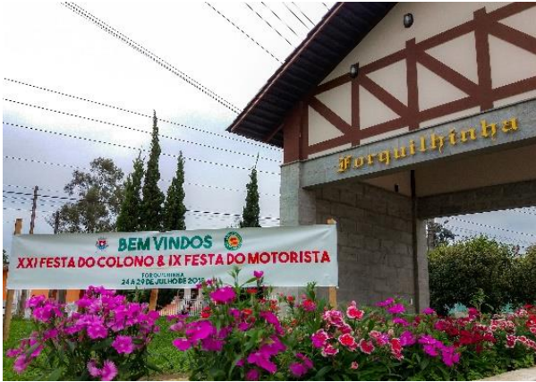
Figure 52 – Recepção no Portal para Festa do Colono e Motorista 2018.