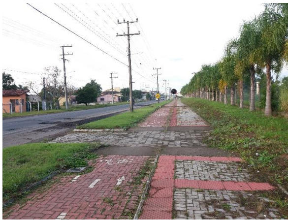
Figure 11 - Ciclovia bairro Vila Lourdes.