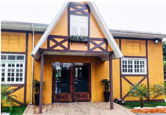
Figure 68 - Restaurante típico Blumenhaus.