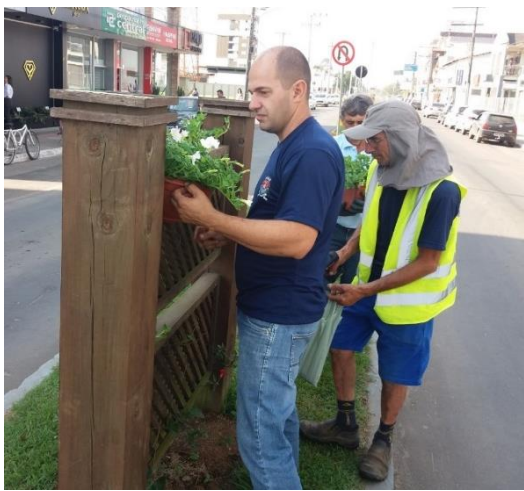
Figure 13 – Preparativos da Avenida 25 de Julho.