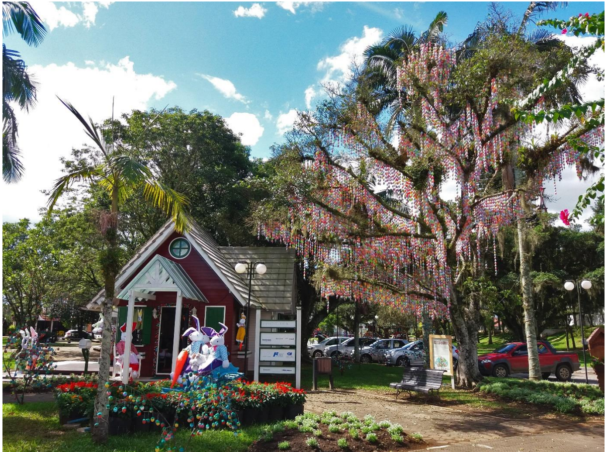
Figure 56 – A maior Osterbaum do Sul de Santa Catarina com 15 mil casquinhas - 2018.