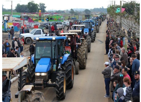
Figure 50 - Desfile de Máquinas agrícolas.