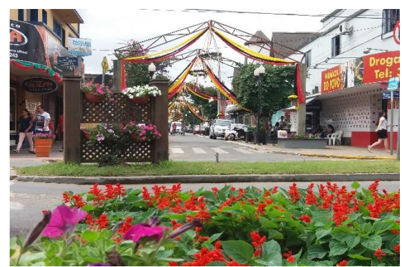
Figure 46 - Decoração urbana para Heimatfest.