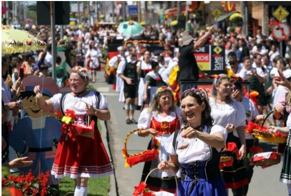
Figure 47 - Desfile Cultural Heimatfest 2018.