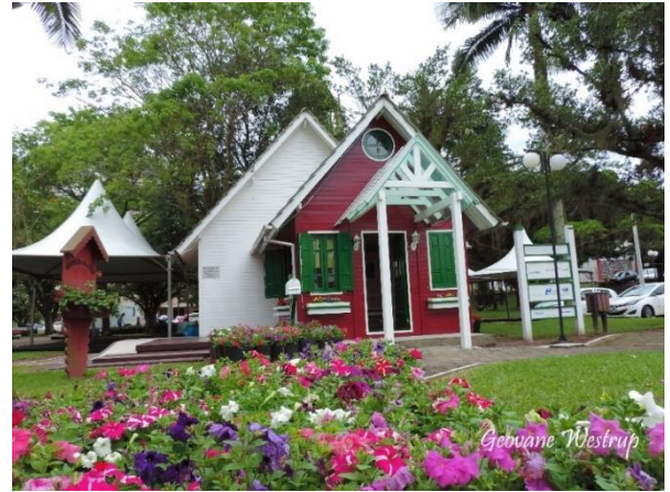
Figure 21 - Praça dos Imigrantes Alemães (parcialmente revitalizada).